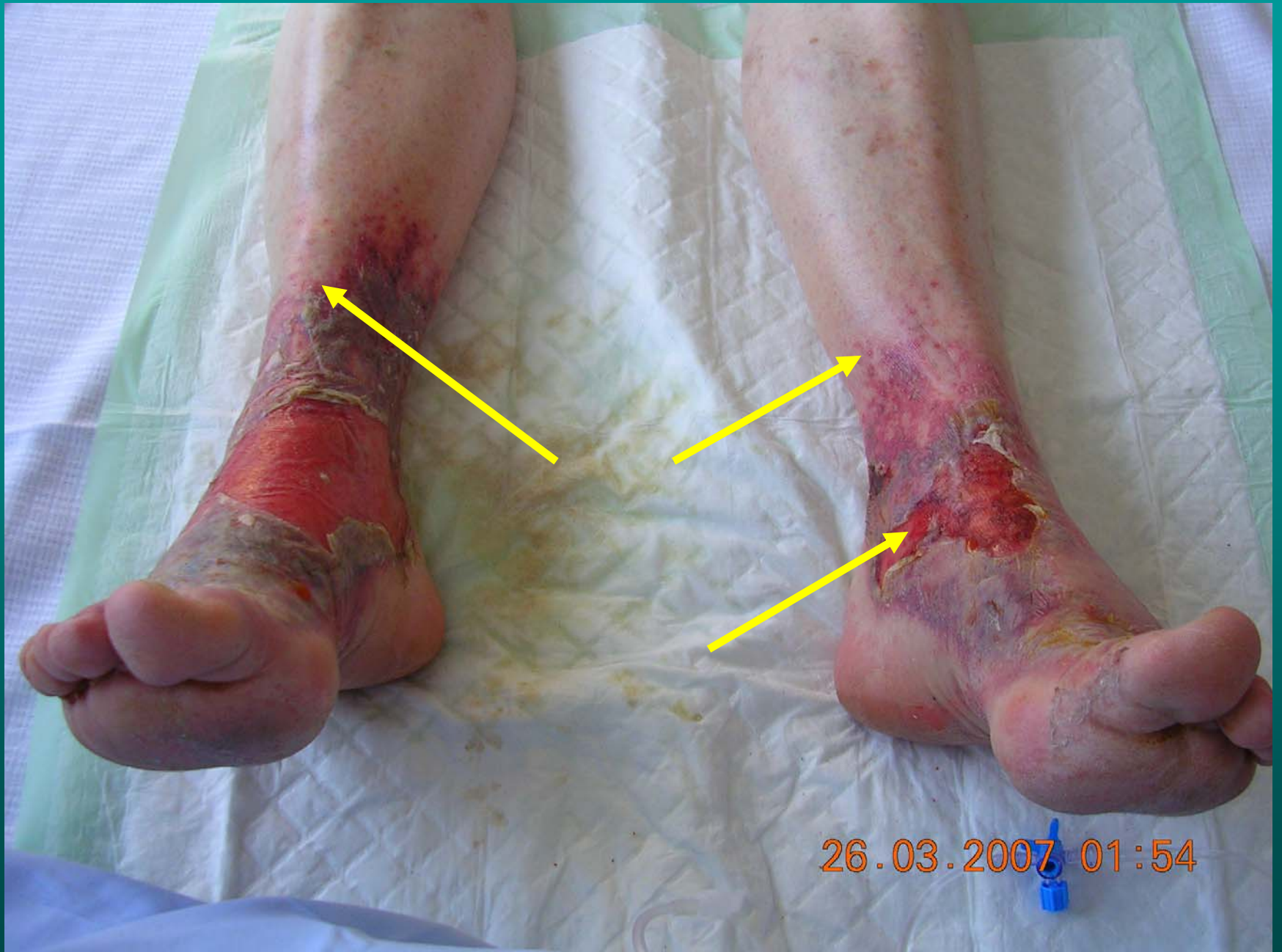
Urgences; Z. Chiche interne DESC Médecine d'Urgence