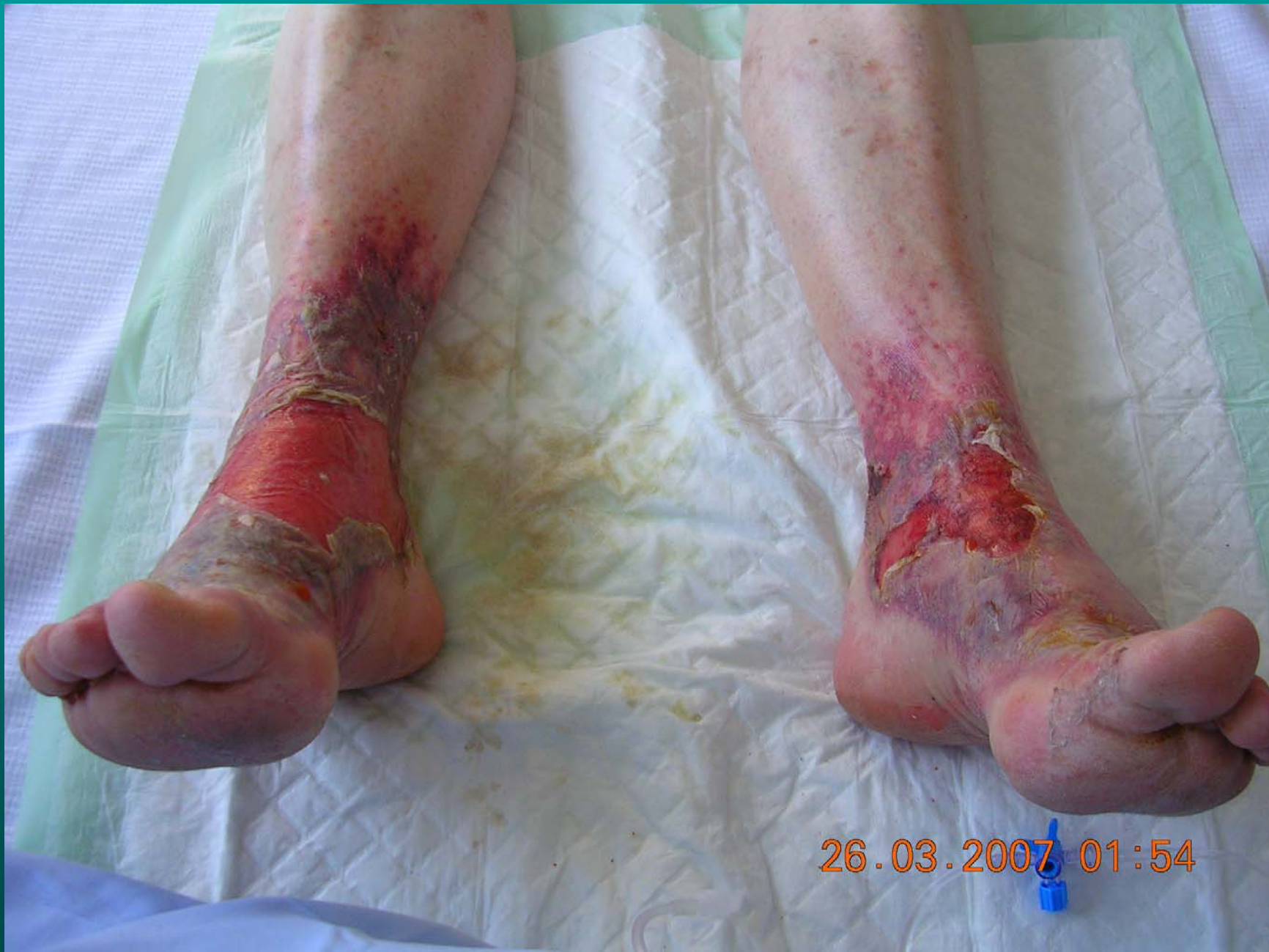
Urgences; Z. Chiche interne DESC Médecine d'Urgence